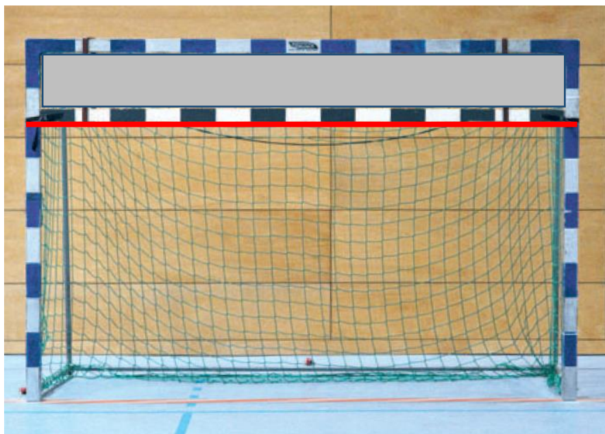
Abbildung 2: Torabdeckung, berührt der Ball einen oberhalb der roten Linie liegenden Teil des Tores ist immer auf Abwurf zu entscheiden

In der F- und E-Jugend wird auf 1,60 m hohe Tore gespielt. Da keine gesonderten Tore vorhanden sind, werden die normalen Tore im oberen Bereich mit einer Plane versehen, um die Höhe zu verringern. Berührt ein Ball diese Abdeckung oder einen auf Höhe der Abdeckung liegenden Teil des Tores, ist immer auf Abwurf zu entscheiden (siehe Abbildung 2). Dies gilt nicht nur beim Penalty, sondern auch im restlichen Verlauf des Spiels. Ob eine Berührung vorliegt ist eine Tatsachenfeststellung der Schiedsrichter.